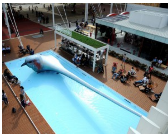
La piscina del Padiglione della Repubblica Ceca

Non solo futuro, a Expo si può viaggiare anche nella memoria. Ecco il Padiglione Zero che accoglie i visitatori all'ingresso del sito espositivo. Al suo interno è possibile ripercorrere la storia dell'Uomo e del suo rapporto con la terra e il consumo di cibo. Qui, prima di scoprire i singoli padiglioni o i nove cluster tematici, si comincia a familiarizzare con il tema di Expo "Nutrire il Pianeta, Energia per la Vita".