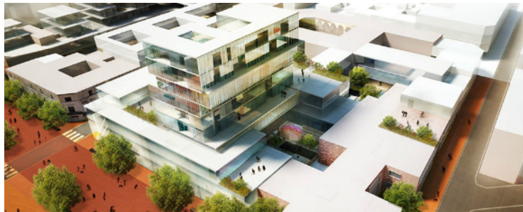
Foto: El auge de las industrias creativas mexicanas tiene su reflejo en Ciudad Creativa Digital, el próximo clúster de referencia de este sector.

Cada mes de octubre la ciudad francesa de Cannes acoge a lo más granado del mundo del entretenimiento y los contenidos creativos en la feria MIPCOM. Gracias a su peso creciente en este sector, especialmente a través del cine, la televisión, los videojuegos y aplicaciones digitales, México ha sido el país protagonista en esta edición. El papel del país como invitado especial forma parte de la estrategia de ProMéxico para impulsar la expansión de los contenidos made in México en el mercado global. El director general de este organismo del Gobierno Federal dedicado a apoyar la internacionalización y las exportaciones mexicanas, Francisco González Díaz, se refirió así al contexto actual de su país durante el discurso inaugural de la feria: "Este es un momento histórico para la industria creativa de México. El éxito en el sector de contenidos es sólo el espejo de la buena salud del país".