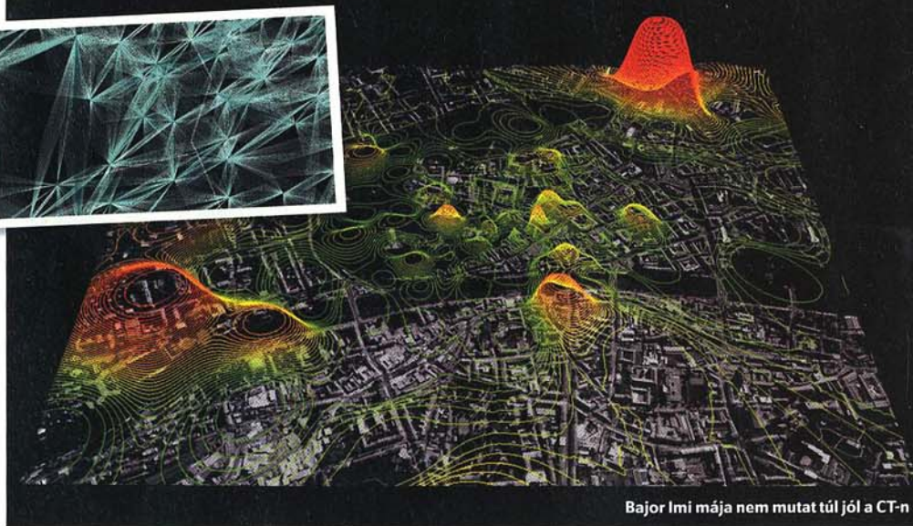
Bajor Imi mája nem mutat túl jól a CT-n