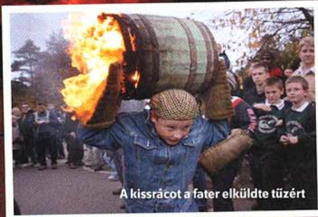
A kissrácot a fater elküldte tűzért