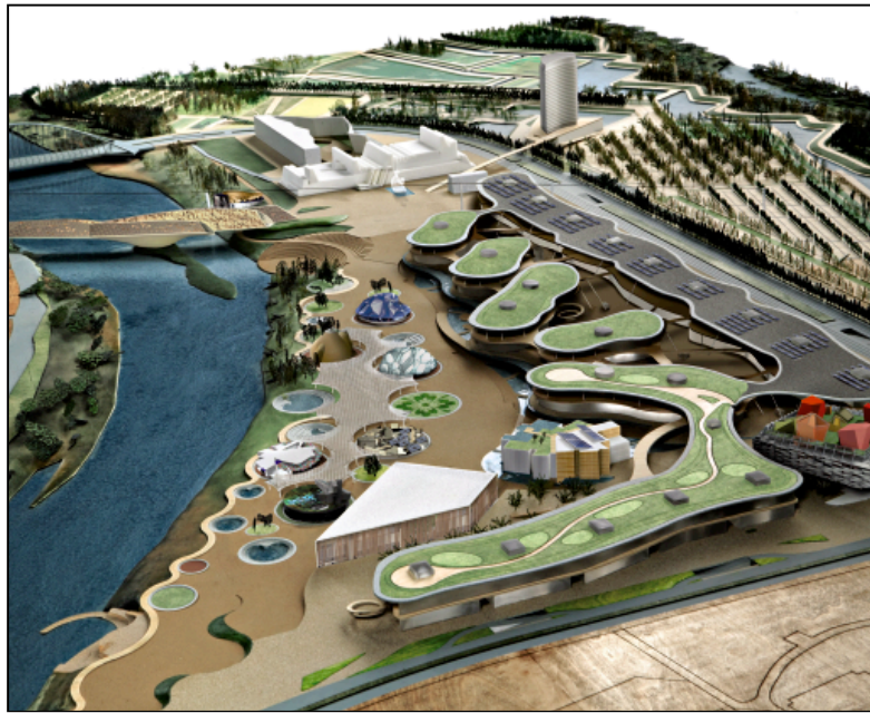
Modello dell'area dell'Expo e, in alto, contestualizzazione urbana

Saragozza cerca dunque di riscattare una condizione d'isolamento e di minore capacità d'attrazione (l'Aragona, regione di cui è capitale, è un'area spopolata, con la minore densità abitativa della penisola iberica) attraverso un «metodo» consolidato, non solo in Spagna: dal 14 giugno al 14 settembre prossimi sarà sede dell'Esposizione internazionale,