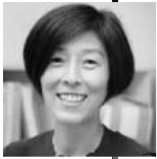
Kazuyo Sejima & Associati, Centro civico di Onishi, Gumma, Giappone, 2003-05 (foto Sanaa). Qui sopra, l'architetto Kazuyo Sejima

Sconvolta sottile nel vuoto latente della Basilica di Vicenza Kazuyo Sejima, con l'aria composta ed enigmatica di una delle impetose adolescenti di Banana Yoshimoto. Insieme al partner professionale dello studio Sanaa — Ryue Nishizawa (Tokyo 1966) — controlla l'effetto dell'immensa sala bianca dove gli esili reperti del loro lavoro galleggiano nella luce filtrata da grandi pareti di tessuto semitrasparente: annullato il tempo della Storia, sublimato il corpo della Materia, sembrano due meticolosi analisti intenti a valutare gli esiti di un esperimento di levitazione programmata. L'aspetto minuto di una figura che si intuisce tuttavia fragile come l'acciaio, suscita qualche perplessità in chi è abituato al glamour delle archistar, ma è forse proprio dall'orientale riserbo della persona che scaturisce, alla lunga, il vero carisma di quest'architetto di culto per migliaia di giovani aspiranti all'arte della costruzione. Come il suo maestro e mentore, Toyo Ito, Kazuyo Sejima (Ibaki 1956) ha infatti la grazia appassita di una giada, la pietra orientale nella cui «luminosità torbida e nebbiosa» Junichiro Tanizaki ci ha insegnato a riconoscere «tutto il lungo passato di una civiltà, ispessito e coagulato in quel suo interno opaco e nuvoloso».