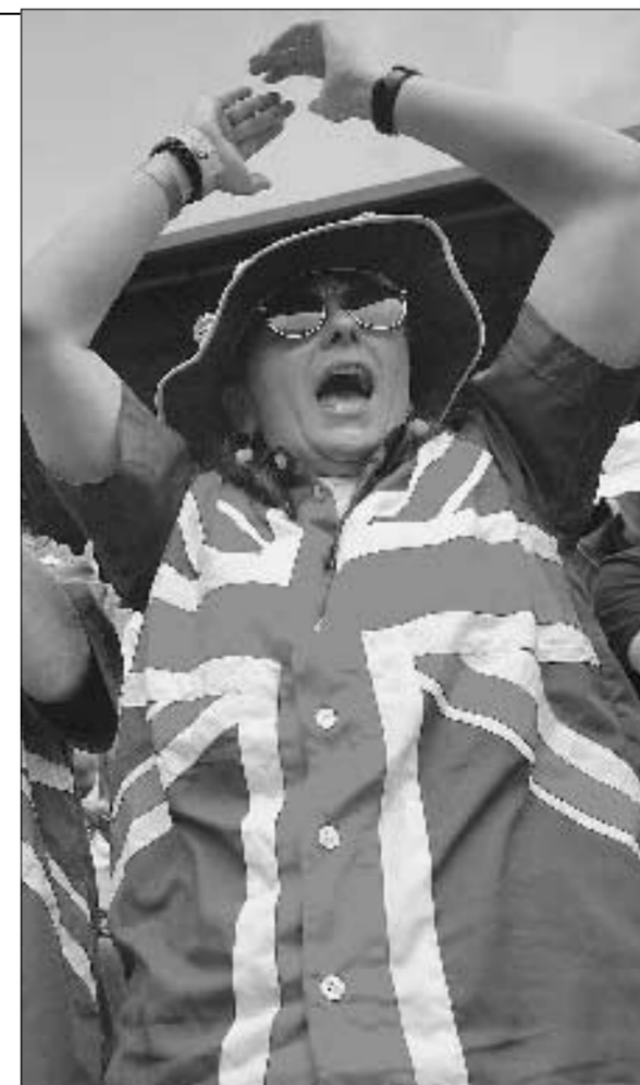
Tifosa inglese a Wimbledon il 2 luglio 2003

contingenti allo stesso evento e per questo ancor più dolorosi. Si capisce dunque perché questo genere di manifestazioni sia eminentemente appetito in quanto palcoscenico di opportunità pubblicitarie di varia natura: dalle sponsorizzazioni alle forniture, dalle strisce a