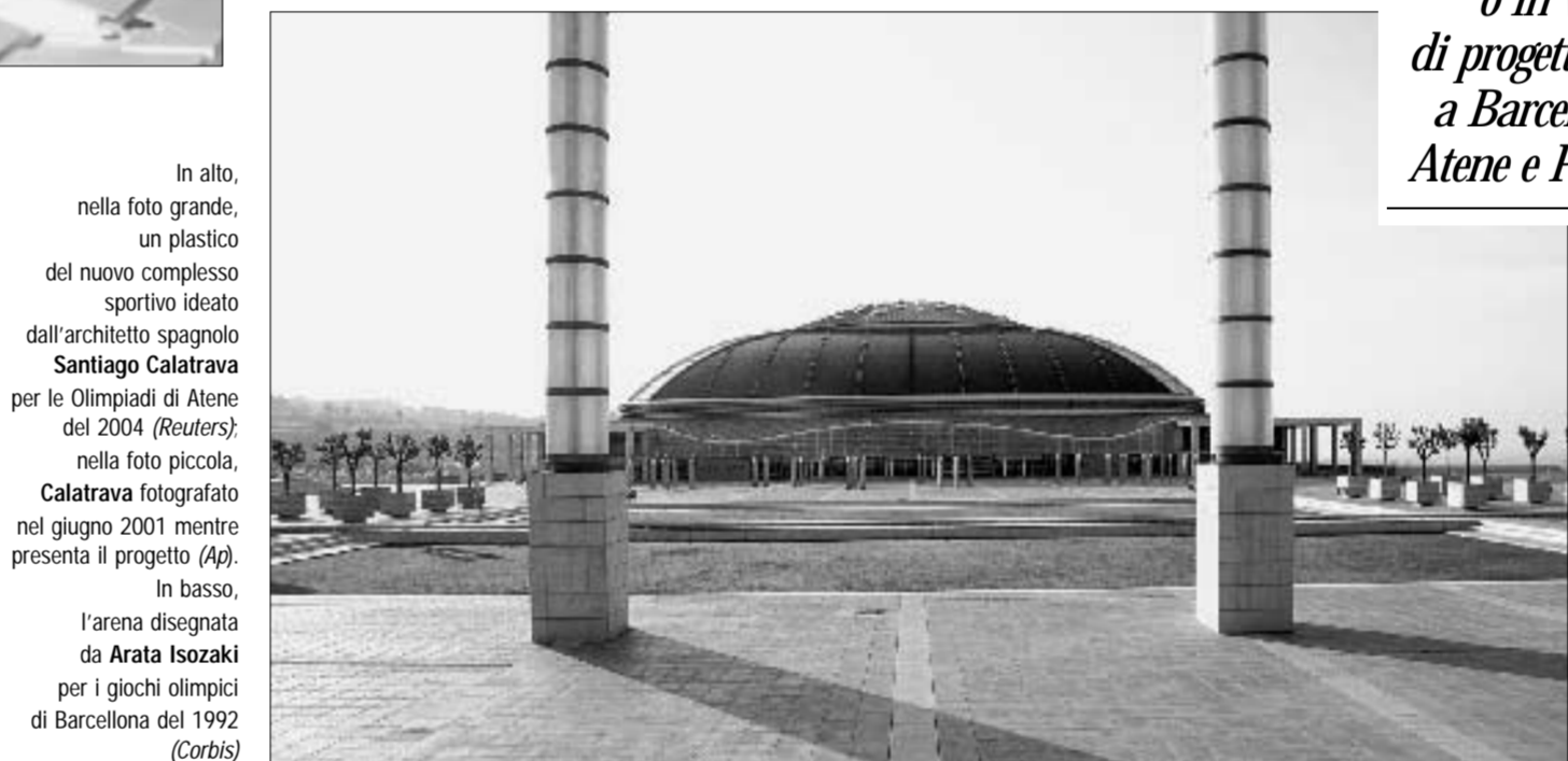
In alto, nella foto grande, un plastico del nuovo complesso sportivo ideato dall'architetto spagnolo Santiago Calatrava per le Olimpiadi di Atene del 2004; nella foto piccola, Calatrava fotografato nel giugno 2001 mentre presenta il progetto. In basso, l'arena disegnata da Arata Isozaki per i giochi olimpici di Barcellona del 1992

e città sotto gli occhi di milioni di spettatori in quello che ormai da tempo costituisce il palcoscenico mediatico della teatralizzazione del meraviglioso nella sua versione agonistica e culturale.