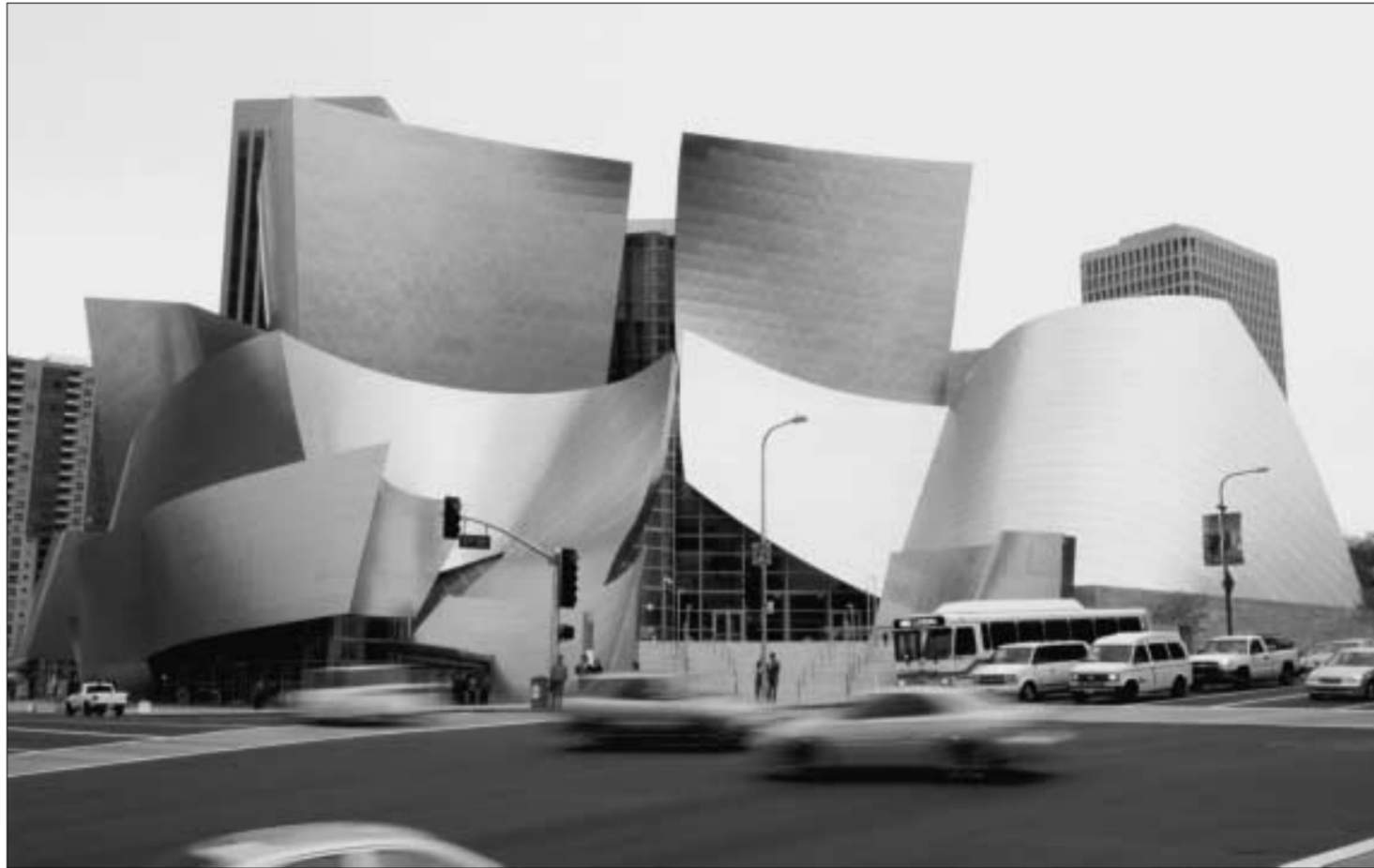
Frank O. Gehry & Associates Inc, Walt Disney Concert Hall Los Angeles, CA, USA, 1989-2003. Sotto, da sinistra: Eladio Dieste, stabilimento agricolo Caputto, 1971-72, particolare del sistema a volta con doppia curvatura; Eisenman Architects, modello della Ciudad de la cultura de Galicia, Santiago de Compostela, Spagna, 1999-oggi

Per raccontarci queste trasformazioni, la mostra articola alterni registri di lettura e, mescolando architettura, arte e fotografia, definisce sette percorsi — Transforma-