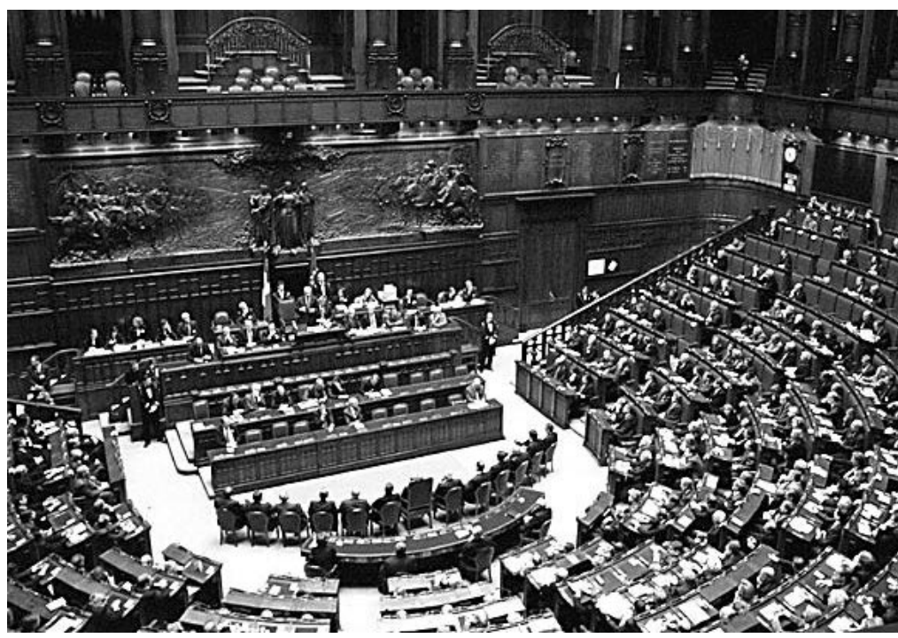
Una seduta della Camera dei deputati: un'ipotesi di riforma potrebbe affidare solo a quest'organo la fiducia al governo

Com'è noto la forma di governo parlamentare è caratterizzata da un lato dal rapporto fiduciario che lega il Parlamento al Governo, dall'altro dalla possibilità per l'Esecutivo di procedere allo scioglimento del