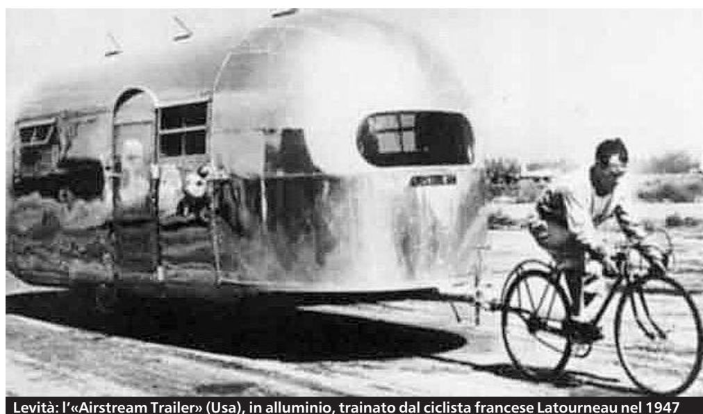
Levità: l'«Airstream Trailer» (Usa), in alluminio, trainato dal ciclista francese Latourneau nel 1947