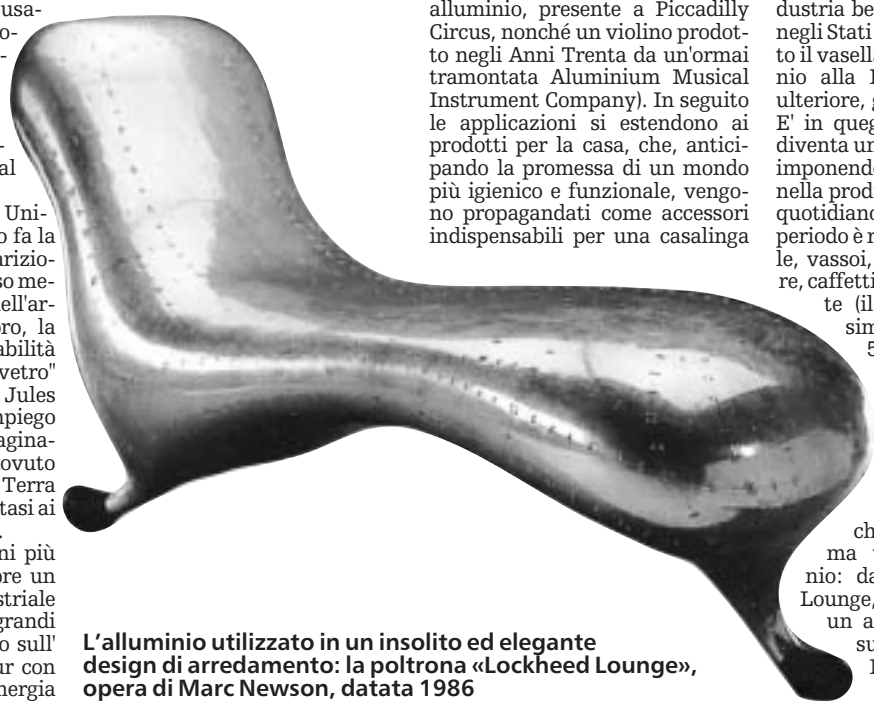
L'alluminio utilizzato in un insolito ed elegante design di arredamento: la poltrona «Lockheed Lounge», opera di Marc Newson, datata 1986

Il prezzo ne risente (scende del 93% in pochi anni) e successivamente la produzione esplose. All'inizio gli impieghi restano limitati ai prodotti di nicchia o d'élite (in mostra a Londra ci sono numerosi gioielli, uno stendardo imperiale di Napoleone III, una statua di Eros gemella di quella, sempre in alluminio, presente a Piccadilly Circus, nonché un violino prodotto negli Anni Trenta da un'ormai tramontata Aluminium Musical Instrument Company). In seguito le applicazioni si estendono ai prodotti per la casa, che, anticipando la promessa di un mondo più igienico e funzionale, vengono propagandati come accessori indispensabili per una casalinga