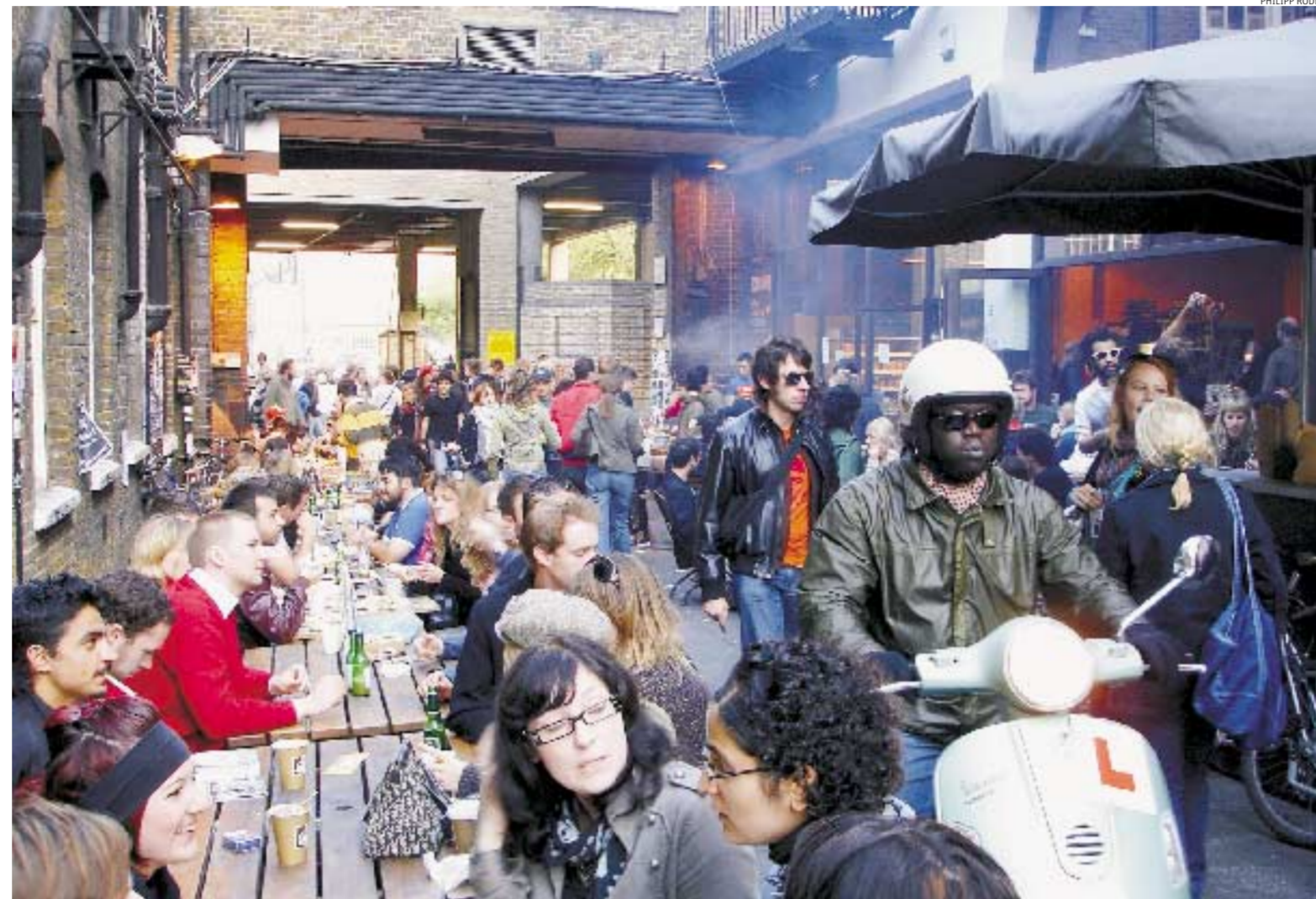
Aggregazioni. Una vecchia fabbrica di birra a Londra (Brick Lane) è diventata un luogo di raduno per i giovani

«Il mondo è colonizzato da grandi progetti di rigenerazione urbana», annuncia ridondante un cartellone nello spazio di Rem Koolhaas e del suo Office for Metropolitan Architecture nel Padiglione Italia dedicato alle città del Golfo. «L'architetto è ridotto all'impotenza», ha affermato in sostanza Norman Foster in presenza del suo committente. I prototipi dell'architettura urbana da Singapore a Dubai sono stravolti; leggiamo sempre nello spazio Koolhaas: «La "comunità" viene intesa come luogo chiuso, il grattacielo è sempre più alto, lo shopping mall più grande, il tutto incementato dallo spazio pubblico, legittimato dal museo e in fine dal capolavoro». Una visione desolante presentata come realtà ineluttabile in cui nessuno si salva. Forse l'Oma farebbe bene a non imputare al linguaggio architettonico ciò che in realtà sono le ri-