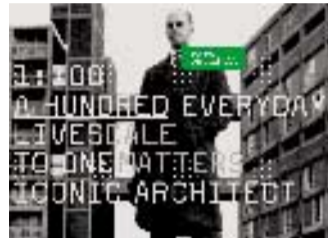
Echo City. Visitatori protagonisti

● Ai Giardini, il commissario Francis Lacloue realizza Métavilla o Metacité, una struttura di tubolari per un'impalcatura vivente. Entrando si accede alla zona cucina, dove si friggono patate e si beve vino rosso, mentre sul retro si apre la zona notte, che ospita dodici cuccette separate da candide tende bianche. L'atmosfera è da compagnia teatrale, allegra, veloce, funzionale per un'architettura insolita.