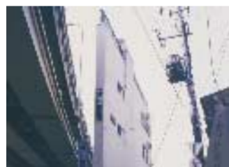
Ricerche. Atmosfere giapponesi

● Prima Tesa delle Vergini all'Arsenale, commissario Pio Baldi, curato da Franco Purini racconta un sogno avveniristico: La Città Nuova. ITALIA-y-2026. Invito a Vema. Una città possibile del 2026, tra Verona e Mantova, progettata da 20 giovani emergenti o gruppi di architettura ai quali è stata affidata una parte, dalla fabbrica alla scuola, ai luoghi del tempo libero.