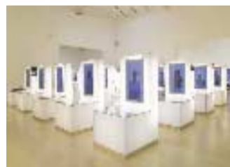
Ciudades. Il padiglione spagnolo

● Ai Giardini, sotto la guida del commissario Terunobu Fujimori si fa esperienza del luogo da abitare secondo un'architettura sconosciuta, frutto di una ricerca svolta all'interno dei principali luoghi del Giappone. Immagini fotografiche i cui autori sono Genpei Akasegawa, Joji Hayashi, Tetsuo Matsuda, Shinbo Minami e Hinako Sugura.