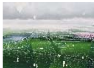
Vema. Il verde tra due città

● Il curatore Jeremy Till, ai Giardini, con un gruppo di autori che rappresentano quasi tutte le discipline dell'arte contemporanea svolge il tema dell'Echo City, un'immagine in scala 1 a 1 in una stanza dove sono installati oggetti vari con cui il visitatore entra in relazione, filmato da una telecamera che poi rimanda l'immagine come un grande specchio.