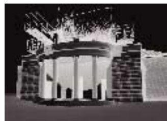
Metacité. Per abitare in allegria